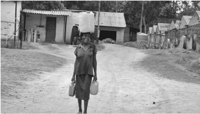
Frauen tragen schwere Lasten

gemischt, gewässert und drei Monate zum Reifen liegen gelassen. Dieses moderne Kompostieren wird auf fast allen Blumenfarmen praktiziert. Zusätzlich haben Blumenproduzenten in den meisten ländlichen Regionen Sonnenhanf angepflanzt, um die Böden zu erhalten und neu zu beleben. Sonnenhanf dient der Bodenpflege und ist eine natürliche Methode um die Fruchtbarkeit der Böden zu erhalten. Er versorgt den Boden mit Nährstoffen und tötet Nematoden 4 , die in ausgelaugten Böden mit hohen Pestizid- und Düngerrückständen vorkommen. Die KleinbäuerInnen, die Tomaten anpflanzen, nutzen zum Teil auch die Gewächshäuser zur Wurzelentwicklung sowie andere neue Technologien.