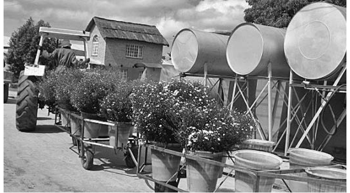
Blumen auf dem Weg zum Kühlhaus

Gartenbau wurde in Simbabwe bereits vor der Unabhängigkeit des Landes im Jahr 1980 betrieben. Gemüse- und Obstbauern züchteten unter anderem Erbsen, Chili, Mais und Passionsfrucht. Diese Produkte wurden für europäische Supermärkte hergestellt, wie zum Beispiel für die britische Supermarktkette Tesco. Simbabwe verfügt über ein günstiges Klima für den perfekten Anbau dieser Feldfrüchte, für die Massenmärkte wie auch für Nischenmärkte. Da die europäischen Importeure von landwirtschaftlichen Produkten auch mit Blumen handelten, führten sie direkt nach der Unabhängigkeit Simbabwes und Untersuchungen von Klima und Boden in den Nachbarländern den Blumenanbau ein. Denn Mosambik hat ein feuchtes Klima, während Südafrika im Winter Frost hat. Folglich fanden sie in Simbabwe das beste Land für den Gartenbau – neben Sambia, das aber zu der Zeit unter einer schwierigen politischen Lage und steigender Inflation litt.