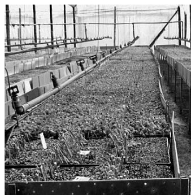
Anzucht der Blumen

Als der Schnittblumenanbau eingeführt wurde, wurden die Produzenten aufgefordert, ihre Bestellungen über nationale Agenturen nach Europa zu schicken. Als aber die Züchter bemerkten, dass in großem Umfang Bestellungen aus Simbabwe bei ihnen eingingen, entschlossen sie sich zur Etablierung der nötigen Technologie direkt in Simbabwe. Dadurch verringerten sich die Kosten der Produzenten. Sie investierten in den Bau von Gewächshäusern zur Vermehrung von Pflanzen und bildeten simbabwisches Personal auf diesem Gebiet aus. Nach erfolgreicher Ausbildung erhielten sie Lizenzen der Züchter, um in deren Namen die Geschäfte fortzuführen. Einige dieser Lizenznehmer wurden auch zu Fortbildungen in die Niederlande,