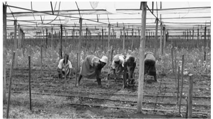
Arbeiterinnen bereiten die Beete vor

Simbabwe hat zum Zeitpunkt dieser Studie insgesamt 25 Konventionen der Internationalen Arbeitsorganisation ratifiziert. 3 Dazu gehören die acht Kernkonventionen zu: