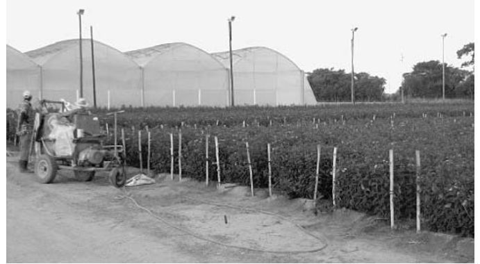
Pestizidsprüher im Freiland

In den Sektoren Agrarchemie und Konstruktion tätige Unternehmen beendeten ihre Aktivitäten oder verlagerten sie nach Sambia oder Kenia, wenn dort ein großes Geschäftspotential vorhanden war. Die Regierung von Simbabwe verlagerte den Fokus ihrer wirtschaftlichen Kooperationen unter der so genannten Look-East-Politik von Europa fort nach Asien. Nach der Einführung der Look-East-Politik kamen mehr Geschäftsleute aus Asien, wie zum Beispiel aus China für Agrarchemikalien und Dünger, aus Russland für die Konstruktion und aus dem Iran für die Herstellung von Traktoren. Diese Länder wurden eingeladen, ihre geschäftlichen Möglichkeiten zu erforschen. Die asiatischen Investoren verursachten entweder die Verlegung oder die Schließung von Betrieben europäischer Unternehmen wie beispielsweise Syngenta Bayer, da sie ihre Produkte wesentlich billiger verkauften. Allerdings ist auch die Qualität der asiatischen Produkte schlechter.