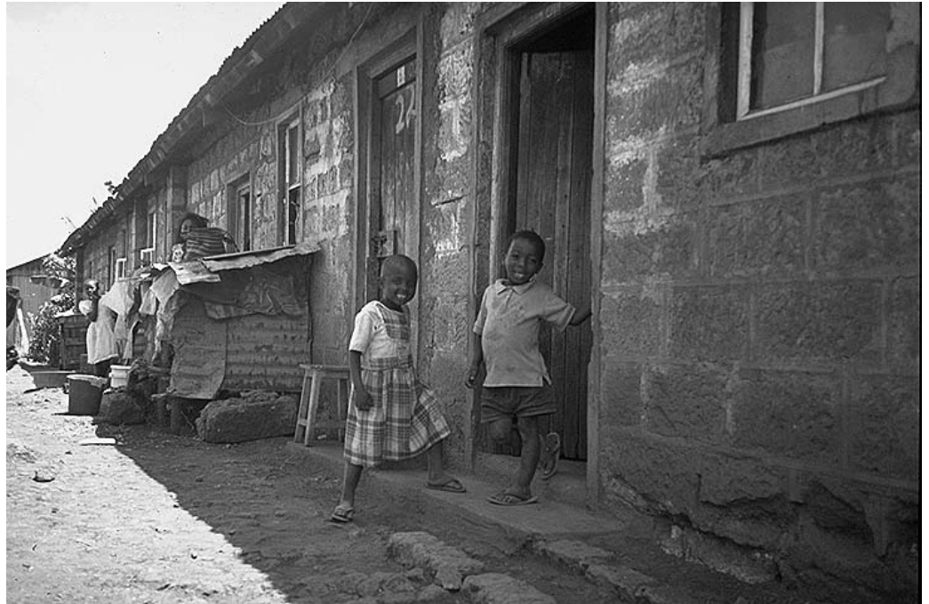
Kinder von Blumenarbeiterinnen

Positivere Beiträge haben Nichtregierungsorganisationen und einzelne ExpertInnen beigetragen, die an verschiedenen Maßnahmen zur Milderung der Probleme, denen die PlantagenarbeiterInnen gegenüberstehen, beteiligt waren. Allerdings haben sich die meisten Bemühungen nur auf die PlantagenarbeiterInnen konzentriert und andere auf dem Plantagengelände lebende Gruppen außer Acht gelassen. Dabei wurde nicht beachtet, dass Situation von Frauen, Jugendlichen und Kindern anders ist als die der männlichen Arbeiter. Abgesehen von der Tatsache, dass sie meist als Gelegenheitsarbeiterinnen angeheuert werden, ist nur wenig über die Lebens- und Arbeitsbedingungen von Frauen auf kommerziellen Plantagen bekannt. Die meisten Untersuchungen zu PlantagenarbeiterInnen haben auch die auf den Plantagen lebenden Jugendlichen und Kinder, nicht einbezogen. Die einzige Organisation in Simbabwe, die die Not von Frauen und Jugendlichen ans Tageslicht gebracht hat und sich um ihr Wohlergehen bemüht, ist die Frauenorganisation Kunzwana. Der Wohlfahrtsansatz von Kunzwana hat es ermöglicht, sich für Bildung und Informationsvermittlung in der Blumenindustrie zu engagieren, die zu 75 Prozent Frauen beschäftigt.