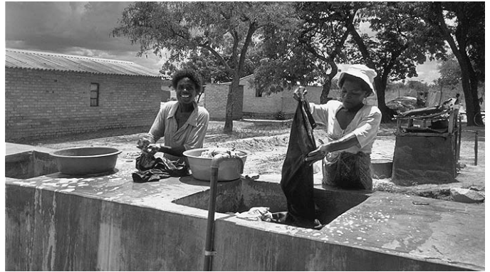
Blumenarbeiterinnen bei der Wäsche

Wenn Frauen berufstätig sind – sowohl Alleinstehende als auch Witwen –, sind sie wirtschaftlich gestärkt. Sie fühlen sich in der Lage, für sich und ihre Familien selbst zu sorgen und haben die Freiheit, ihre Fähigkeiten zu zeigen. In ihrer Berufstätigkeit bilden sie Arbeitsteams und schließen Freundschaften. So fühlen sich diese Frauen bei Aufnahme einer Arbeitstätigkeit aufgrund des Lohns, den sie am Ende des Monats erhalten, wirklich sicher, für ihre Familien sorgen zu können.