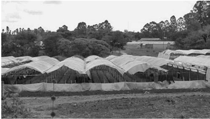
Blumenproduktion unter Plastikplanen

Die Produktion von Schnittblumen und Füllgrün ist für Simbabwe sehr wichtig, denn sie trägt bedeutend zur Erwirtschaftung von Devisen bei. Die Wirtschaft Simbabwes beruht im Wesentlichen auf Landwirtschaft und Bergbau. Die Produktion von Schnittblumen und Füllgrün spielte seit ihrer Einführung zu Beginn der 1980er Jahre in der Wirtschaft eine Vorreiterrolle. In ihren ersten Berichten drückten sowohl die Finanzbehörden als auch andere Handelsinstitutionen wie der Simbabweische Rat für die Förderung von Handel und Gartenbau ( Zimbabwe Trade, Horticulture Promotion Council ) und der Exportverband der simbabwischen Blumenzüchter ( Export Flower Growers of Zimbabwe ) ihren Respekt für den Sektor aus, da er nach Gold und Tabak die dritthöchsten Devisen erwirtschaftete. Der Sektor prägte auch die Perspektive des Landes.