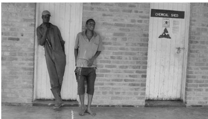
Arbeiter vor der Pestizidkammer

Vor der Einführung des US-Dollar war der kollektive Verhandlungsprozess aufgrund der Inflationswellen, die später durch den Dollar gekappt wurden, sehr schwierig. Momentan ist die Arbeitssituation stabil, denn die ArbeiterInnen können nun ihre Lebensmittel kaufen. Die Sozialversicherung der Blumenfarmen ist die National Social Security Authority (NSSA). ArbeiterInnen wie auch Farmer zahlen hier Beiträge für die Sonderzahlungen an die ArbeiterInnen. Die ArbeiterInnen haben hierdurch ein Recht auf Beihilfe bei Beerdigungen, Invalidität, Beihilfen oder Renten für Hinterbliebene oder beim Eintritt in den Ruhestand.