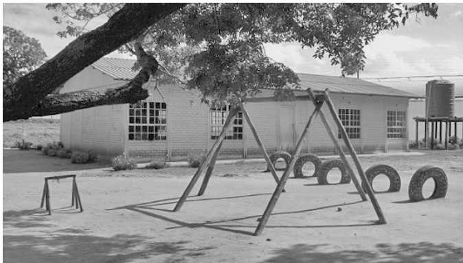
Kinderspielplatz einer Blumenfarm

Aufgrund der hohen Sterberate wegen HIV/AIDS haben einige dieser Kinder keine Familienangehörigen, die sich um sie kümmern. Daher müssen sie den Lebensunterhalt für sich selbst und andere Familienmitglieder verdienen. Kinderarbeit wird als billige Arbeit angesehen. Einige Kinder laufen aus der Schule davon, um für wenig Geld zu arbeiten.