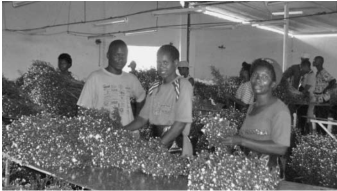
Arbeiterinnen sortieren die Blumen

Die Blumenindustrie wuchs schnell und brachte eine Menge Möglichkeiten mit sich. Sie stand an dritter Stelle bei der Schaffung von Arbeitsplätzen. Während der Blütezeit dieser Industrie im Zeitraum Ende der 1980er Jahre bis 1999 waren im ganzen Land allein im Blumensektor 13.000 ArbeiterInnen beschäftigt. Von der Schaffung von Arbeitsplätzen profitierten vor allem Frauen. Gegenwärtig beschäftigt der Sektor weniger als 4.000 ArbeiterInnen. Jeder Betrieb beschäftigt zu 75 Prozent Frauen.