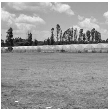
Erweiterung einer Blumenplantage

Als Simbabwe vom Fieber des Blumenanbaus erfasst war, wuchs diese Industrie schneller als jeder andere Wirtschaftssektor. Ermöglicht wurde dies durch enorme ausländische Investitionen von Ländern wie den Niederlanden, Deutschland und Polen. Die mit Blumen bebaute Fläche dehnte sich schnell aus, die Exportzahlen stiegen von Saison zu Saison. Diese Ausdehnung der Blumenindustrie zog die Aufmerksamkeit einer Reihe von namhaften Blumenzüchtern der Welt auf sich wie beispielsweise DeReuiters-Holland, Meiland und NIRR International-France. Diese Firmen arbeiteten sehr eng mit den Blumenbetrieben vor Ort zusammen.