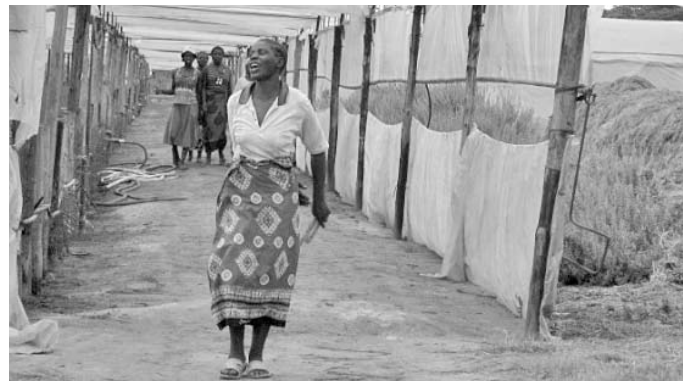
Arbeiterin im Gewächshaus

Es gibt langfristige und saisonale Beschäftigung im Blumensektor. Da die Blumensaison nur von September bis Mai dauert, stellen die Plantagenbetreiber nicht jedeN ArbeiterIn fest ein. SaisonarbeiterInnen werden höchstens acht aufeinander folgende Monate beschäftigt. Andernfalls schreibt das simbabwische Arbeitsgesetz eine feste Anstellung vor.