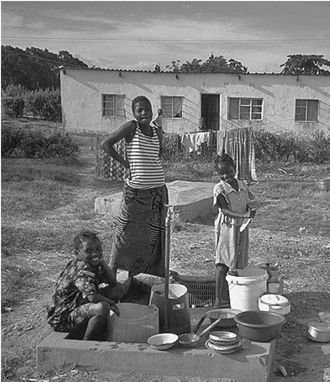
Töchter verrichten die Hausarbeit

Land, weil sie die Kredite nicht zurückzahlen konnten und das Land als Hypothek eingesetzt hatten. Ihre Ländereien wurden versteigert und von Investoren gekauft, die der Blumenzucht nichts abgewinnen konnten. Angesichts der zeitgleichen Wirtschaftszession in Europa entschieden sich die neuen Besitzer dafür, die Rosenzucht durch Tomatenanbau für die lokalen Märkte zu ersetzen. Eine Reihe von Ländereien gingen in den Besitz der Banken über und wurden aufgrund der nötigen Investitionen in die Infrastruktur nicht mehr wie zuvor bewirtschaftet. All dies wirkte sich negativ auf den gesamten Blumensektor aus.