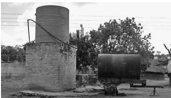
Wasserreservoir einer Blumenplantage

Die Entwaldung und das Abbrennen der Felder führt womöglich zu globaler Erwärmung. Die Verminderung der Pflanzenfläche reduziert die Photosynthese, dies führt wiederum zu einem erhöhten Anteil von Kohlendioxid in der Atmosphäre. Kohlendioxid reagiert in einer Serie von photochemischen Prozessen mit Ozon, was die Ozonschicht vermindert.