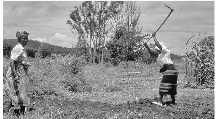
Frauen bei der Feldarbeit