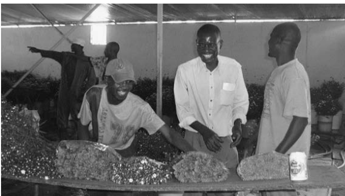
Sommerblumen für den Export

Kunzwana Women's Association hat unermüdlich für das Wohl der PlantagenarbeiterInnen gearbeitet und dazu beigetragen, das Leben dieser ArbeiterInnen zu verbessern. Aber die Gewerkschaften knüpfen nicht an den Bemühungen von Kunzwana an. Kunzwana unterstützt insbesondere Frauen. Sie bilden die Mehrheit der ArbeiterInnen und werden von den Gewerkschaften benachteiligt. Denn die Gewerkschaften vertreten die Frauen nicht und scheinen noch nichts von Gleichberechtigung gehört zu haben. Es gibt kaum eine Frau in der Führungsetagen der Gewerkschaften. Das zeigt deutlich, dass sie weder die Vertretung von Frauen schätzen noch die Verbesserung der Arbeitsbedingungen von Frauen. Wenn sie für die Stärkung von Fraueninteressen eintreten würden, würden sie den Sektor unterstützen, der die Frauen beschäftigt.